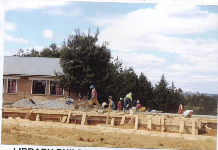
LIBRARY BUILDING ON CONSTRUCTION AT CONCRETE FLOOR SLAB