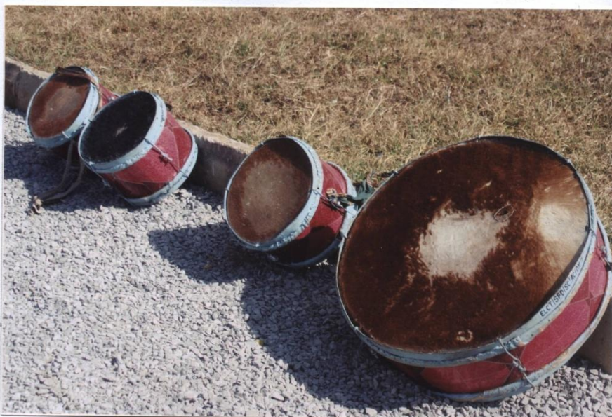
STUDENTS' RECREATION DRUMS