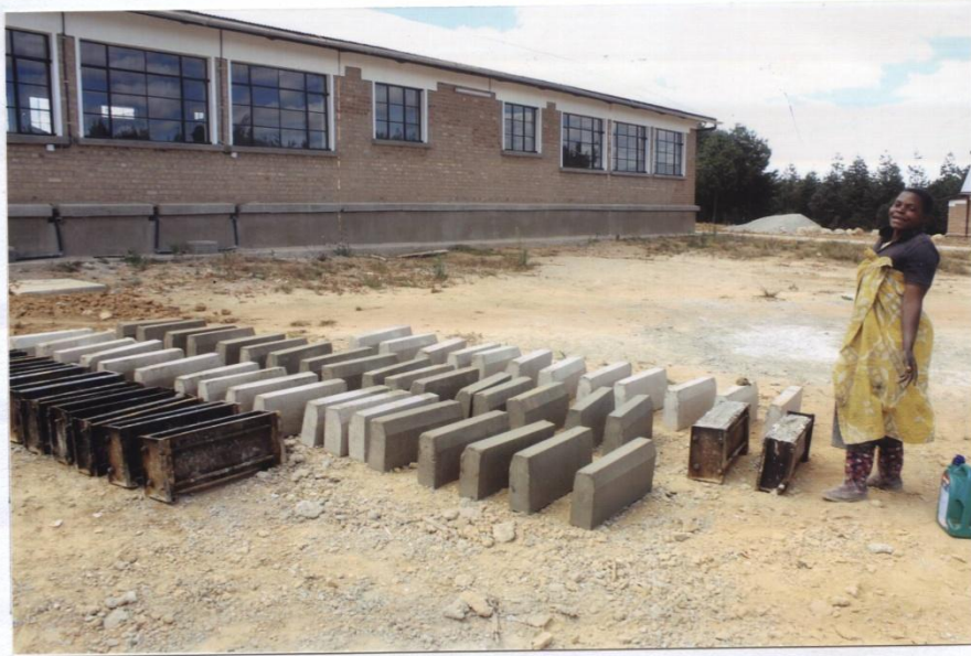
PRODUCTION OF KERBSTONES ON PROGRESS