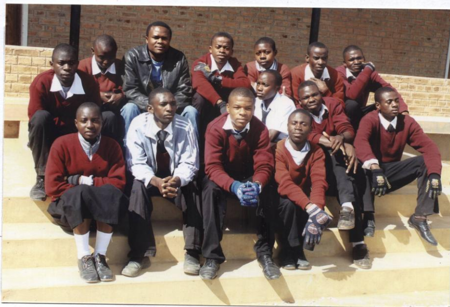
MIXED CLASSES DEAF STUDENTS WITH THEIR TEACHER

Kuvia englanninkielisestä hankeraportista: