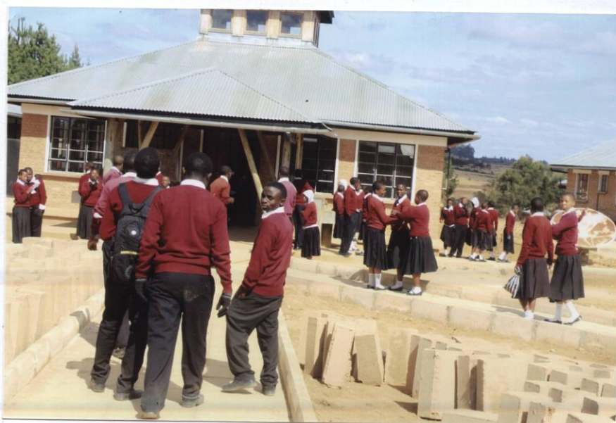
DEAF STUDENTS GOING TO TAKE BREAKFAST