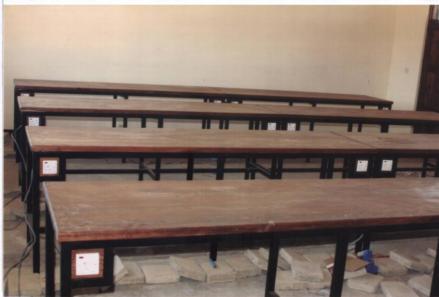
PHYSICS LABORATORY AFTER BENCH FITTING