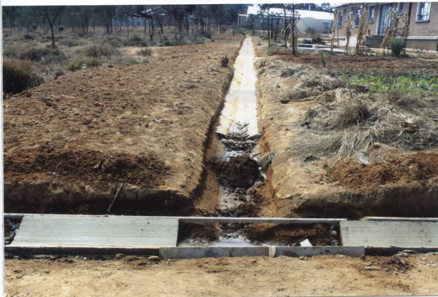
STORM WATER DRAINAGE ON PROGRESS