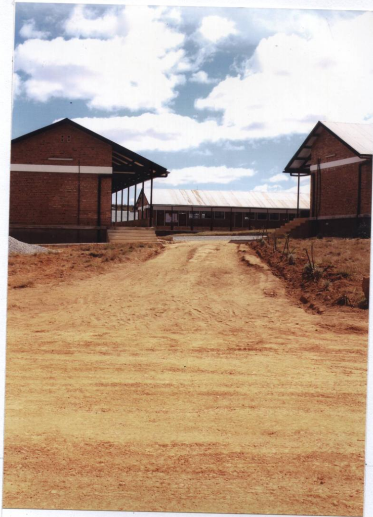
LANDSCAPING FROM ADMINISTRATION BLOCK TO THE CLASSROOMS ON PROGRESS