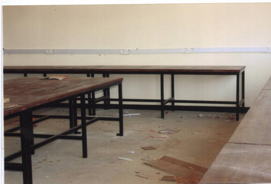
COMPUTER ROOM WITH BENCHES FITTED